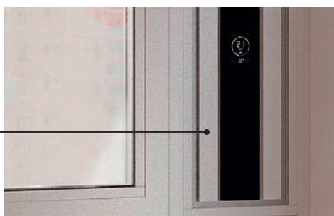
Rys. 6: otwarcie wewnętrznej osłony w celu wykonania czyszczenia